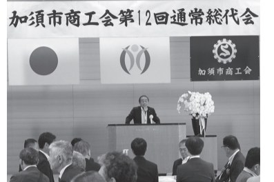
加須市商工会第12回通常総代会

令和6年度通常総代会が5月24日(金) 16時より市民プラザかぞにて開催されます。通常総代会では、今年度の事業報告、決算、新年度の事業計画や予算など重要案件のご審議をお願いすることとなりますので総代の皆様にはぜひご出席をお願いいたします。